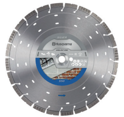
DISCO VARI-CUT S50 300x25,4 mm